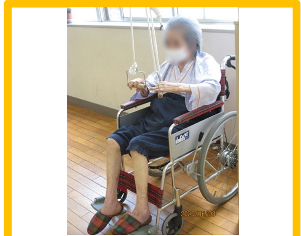
機械を使っでの運動です。 上手く出来るでしょうか。