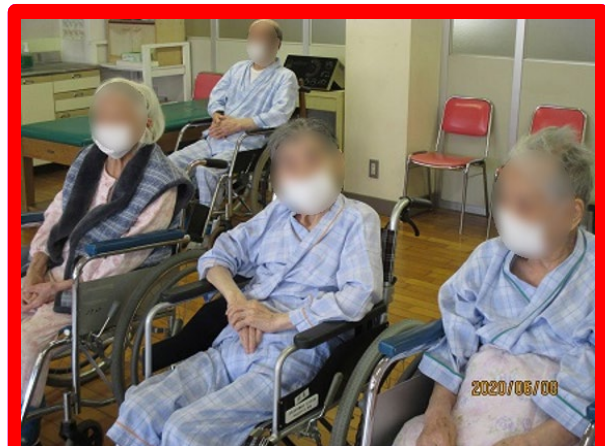
皆さん順番が来るまで待っています。 リラックスしています。