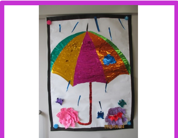
職員が壁面を作りました。 梅雨をイメージしています。

6月のレクリエーションは先月に続きコロナの為お休 みします。再開できるようになりましたら改めてご連 絡致します。6月からモニターで面会ができるよう になりました。みなさん是非ご利用下さい。